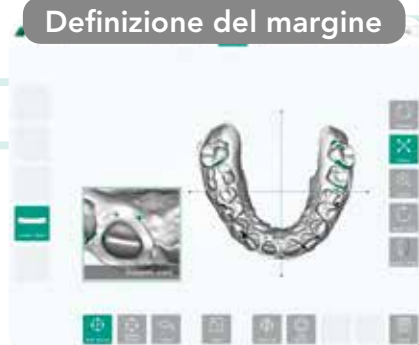
Definizione del margine