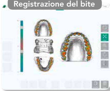
Registrazione del bite