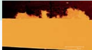
Запълване на порите