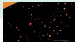
Dubina prodiranja 30-50 µm