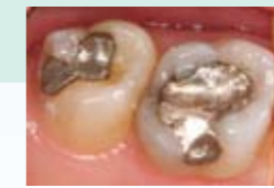
Stražnji ispun iz materijala EQUIA - prije