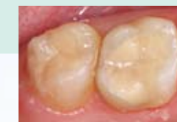
Stražnji ispun iz materijala EQUIA - poslije