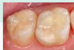
Seitenzahnrestauration mit EQUIA – Nachher