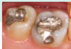
Seitenzahnrestauration mit EQUIA – Vorher