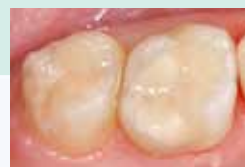
Restauración posterior con EQUIA – Después