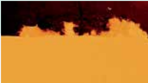
Sellado de irregularidades de la superficie