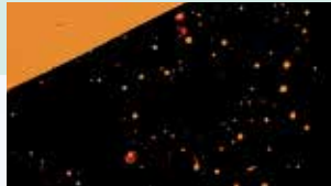
Profundidad de penetración, relleno de porosidades