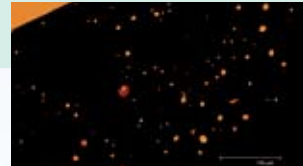
Длабочина на пенетрација 30-50 µm