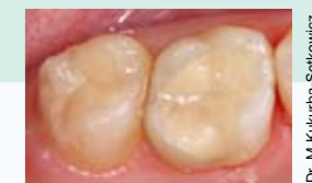
Реставрация зуба жевательной группы с применением системы EQUIA - После