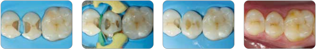
Cas clinique par Dr Javier Tapia Guadix (Espagne)

Essentia rend les restaurations postérieures plus naturelles sans effort supplémentaire