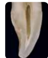
Prof. Marleen Peumans (Belgija)

Tradicionalni sistem boja bazira se na različitim tonovima (bojama), poznatim kao A, B, C i D. Međutim, zna se da gled i dentin imaju različita svojstva , koja doprinose završnoj percepciji boje zuba. Oslobođajući se tradicionalnih monohromatskih boja te koncentrišući se na reprodukciju karakteristika gleđi i dentina , možete postići mnogo prirodniji rezultat sa samo dva jednostavna sloja boje.