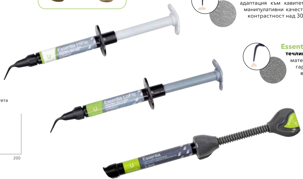
Флексурална якост и 3-слойно износване на трите вискозитета на Essentia Universal shade

Essentia е пастовиден композит с опростена цветова концепция от 7 цвята. Неговият Универсален цвят показва великолепен ефект на сливане в съчетание с кондензируема консистенция : перфектен за монокроматични дистални възстановявания.