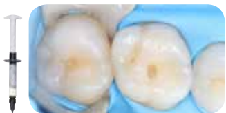
Preparacija malih kaviteta klase I