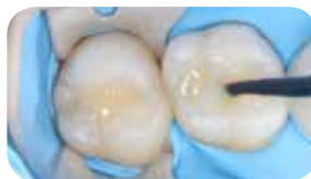
Ispun materijalom Essentia HiFlo Universal