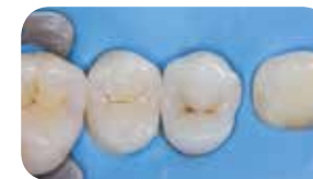
Izrada ispunjena materijalom everX Posterior kao dentinskom osnovom te Essentia Universal kao vanjskom oblogom