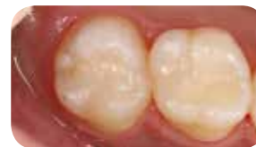
Postoperativni izgled prikazuje izvrsno spajanje s prirodnim zubima