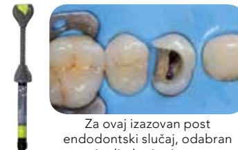
Za ovaj izazovan post endodontski slučaj, odabran je direktni pristup