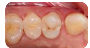
Kontrola nakon šest mjeseci pokazuje dobru integraciju s okolnim dentalnim tkivima