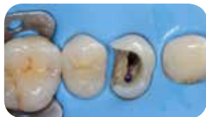
Ennél a post endo esetenél a direkt megközelítésre esett a választás