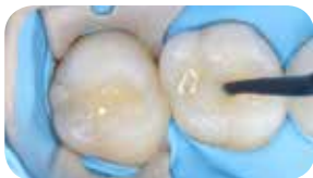
Restauráció Essentia HiFlo Universal használatával