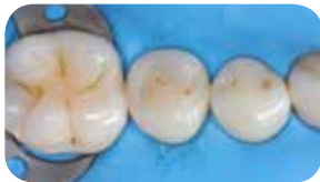
Restauráció Essentia LoFlo Universal használatával