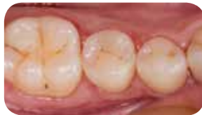
Post-operatív nézet a polírozást követően