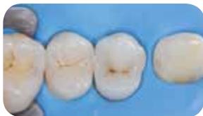
A dentin mag everX Posterior , a külső héj Essentia Universal anyaggal helyreállítva