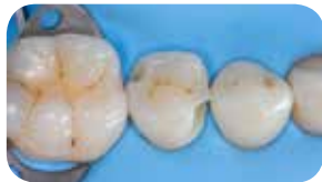
A lézió abráziója levegővel