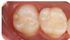
Posztoperatív kép, amely a természetes fog színével való tökéletes illeszkedést mutatja