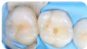
Kisebb I. osztályú kavitások preparációja