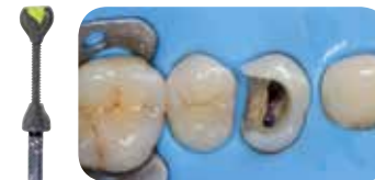
Pentru acest caz post-endodontic dificil s-a optat pentru o abordare directă