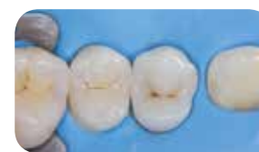
Restavracija z everX Posterior kot jedrom in Essentia Universal kot zunanjim obodom