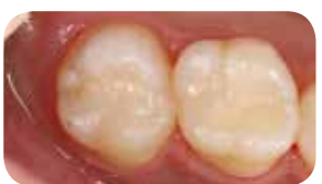
Post-operativni pogled kaže odlično ujemanje z naravnimi zobmi