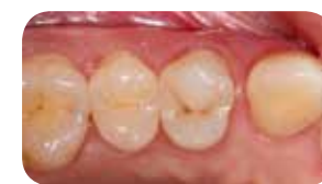
6 mesečna kontrola kaže dobro barvno integracijo z okolnimi zobnimi tkivi