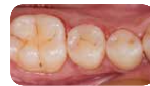
Post-operativni pogled po poliranju

Essentia HiFlo je tekoči kompozit z visoko močljivostjo , odličen za enostavno adaptacijo v preparaciji, da steče v ozke kavitete. Ponuja odlične sposobnosti rokovanja skupaj s superiorno trdnostjo in visoko radioopačnostjo do preko 300%, kar pospeši diagnozo sekundarnega kariesa.