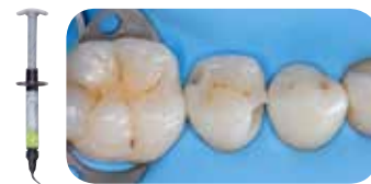
Zračna abrazija ne-kariozne lezije