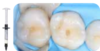
Preparacija majhne kavitete Razreda 1