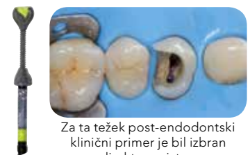
Za ta težek post-endodontski klinični primer je bil izbran direkten pristop