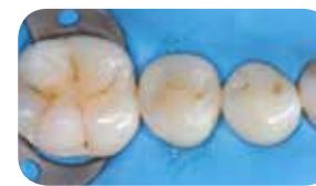
Restavracija z Essentia LoFlo Universal