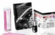
GC G-aenial® Bond