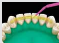
4. Bandozza és fénykezelje!