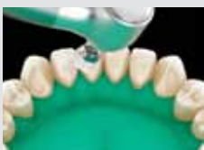
2. Tisztítsa meg a fogat!