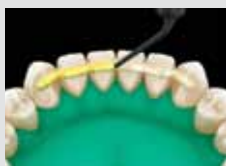
7. Fedje le a folyékony kompozittal!