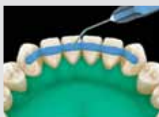
3. Savazza le a bondozandó felületet 45-60 másodpercig!