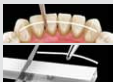
1. Vágja méretre a szálát!