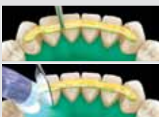
6. Helyezze el a szálát és fénykezelje foganként 5-10 másodpercig!