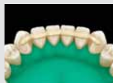
8. Fénykezelje foganként 40 másodpercig és finirozza!