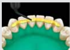
5. Applikálja a folyékony kompozitot, de ne fénykezelje!