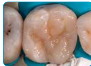
Τελικό στρώμα με Essentia (απόχρωση universal)