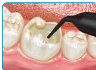
Εφαρμόστε το Ever X Flow στην κοιλότητα