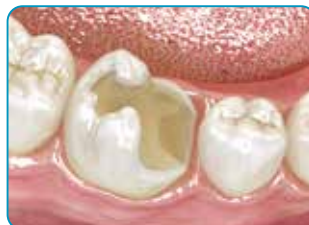
Προετοιμασία της κοιλότητας

Απόχρωση οδοντίνης για αποτελέσματα υψηλής αισθητικής