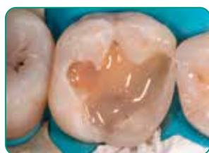
Applicering af everX Flow (Dentin farve)