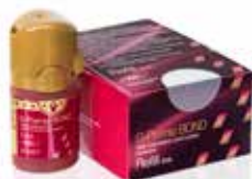
G-Premio BOND Universal bonding