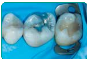
Tak til Dr Javier Tapia Guadix, Espanja

Takket være de tixotropiske egenskaber, flyder everX Flow og vil nemt adaptere til alle kavitetetsvægge og præparationer og dermed undgå porøsiteter. Med det kontrollerede flow kan du let placere det i overmundet uden at det flyder ud.