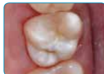
Izgled nakon restauracije