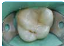
Završni sloj s G-aenial Universal Injectable (A3 boja)