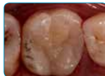
Izgled nakon restauracije