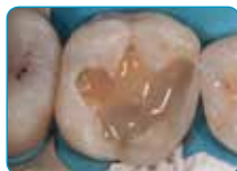
Nanošenje kompozita everX Flow (Dentin (dentinska) boja)