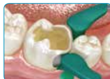
Kod kaviteta klase II, stijenke koje nedostaju izraditi iz konvencionalnog kompozita