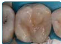
Završni sloj Essentia kompozita (Universal (univerzalna) boja)