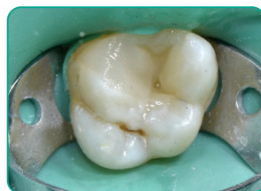
Végző réteg G-aenial Universal Injectable (A3 szín)