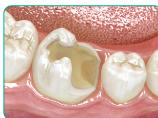
Készítse elő a kavitást