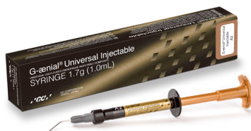
G-aenial Universal Injectable Nagy erősségű, injektálható restauratív anyag