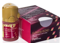
G-Premio BOND Univerzális bondanyag