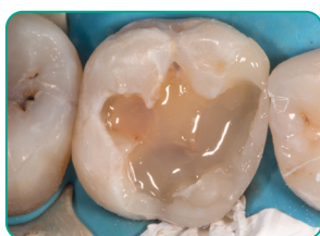
everX Flow applikálása (Dentin szín)