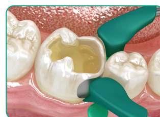
II. osztályú kavitás esetén a hiányzó falakat hagyományos kompozittal építse fel