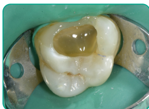
everX Flow applikálása (Bulk szín)