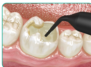
Töltse fel az üreget everX Flow anyaggal