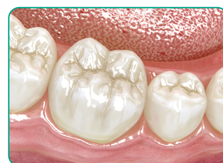
A végeredmény, hagyományos kompozittal történő fedés után