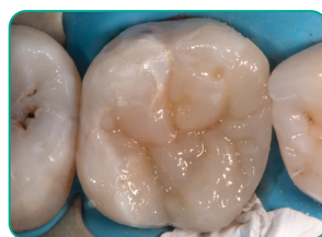
Végző réteg Essentia (Universal szín)