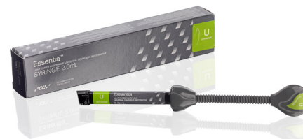
Essentia Universal Univerzális, paszta állagú kompozit

Az everX Flow, Essentia, G-Premio BOND és G-aenial Universal Injectable a GC védjegyei. A Filtek Bulk Fill Flowable, SDR flow+ és Tetric EvoFlow Bulk Fill nem a GC védjegyei.