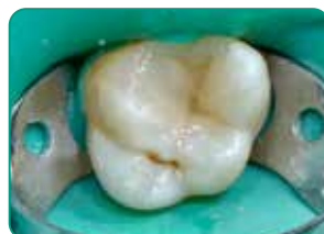
Galutinis sluoksnis su G-aenial Universal Injectable (A3 spalva)