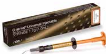
G-aenial Universal Injectable Itin stipria takia restauracine medžiaga