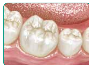
Galutinis vaizdas po restauracijos padengimo įprastiniu kompozitu