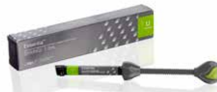
Essentia Universal Universalia kompozitive plomba

everX Flow, Essentia, G-Premio BOND ir G-aenial Universal Injectable yra GC kompanijos prekiniai ženklai. Filtek Bulk Fill Flowable, SDR flow+ ir Tetric EvoFlow Bulk Fill nėra GC kompanijos prekiniai ženklai.