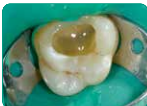
everX Flow aplikacija (Dideliam sluoksniui skirta spalva)