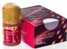
G-Premio BOND Universalia jungiamąja medžiaga