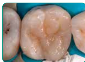
Pēdējais slānis ar Essentia (universālā krāsa)