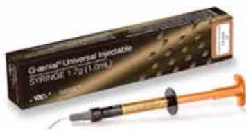
G-aenial Universal Injectable Augstas izturības injekcijas konsistences kompozīts