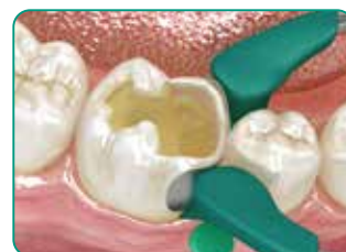
II klases kavitātē vispirms ar standarta kompozītmateriālu atjaunojiet trūkstāšo sienu