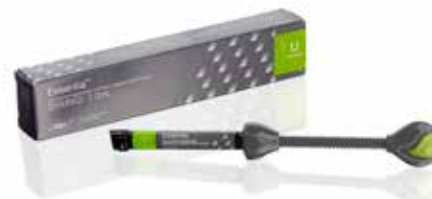
Essentia Universal Universālais pastaš konsistences kompozīts

everX Flow, Essentia, G-Premio BOND un G-aenial Universal Injectable ir GC tirdzniecības zīmes. Filtek Bulk Fill Flowable, SDR flow+ un Tetric EvoFlow Bulk Fill nav GC tirdzniecības zīmes.