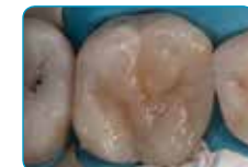
Завршен слој со Essentia (Универзална боја)