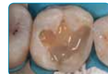
Нанесување на everX Flow (Дентинска боја)