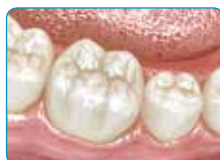
Краен резултат после прекривање со вообичаениот композит