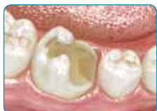
Подгответе го кавитетот

Дентинска боја за високи естетски резултати