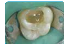
Нанесување на everX Flow (Балк боја)