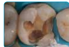
Препаација на кавитет