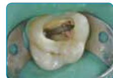
Препаација на кавитет