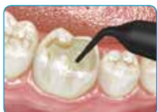
Исполнете го кавитетот со everX Flow