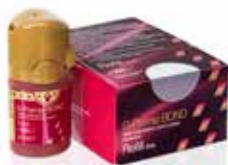
G-Premio BOND Universal bonding