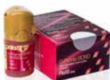
G-Premio BOND Universalbonding