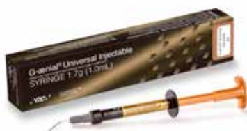
G-aenial Universal Injectable Flytande tixotrop komposit