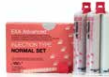
EXA Advanced Injection Fraguado normal