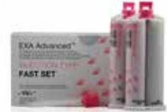
EXA Advanced Injection Fraguado rápido