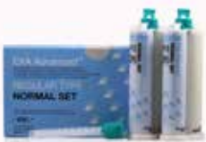
EXA Advanced Regular Fraguado normal

Material de impresión de silicona de adición