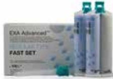
EXA Advanced Regular Fraguado rápido