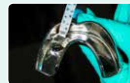
2. Naplňte otiskovací lžici hmotou EXACLEAR a nasadte na wax-up na modelu