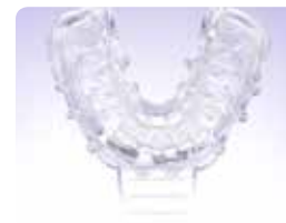
2. Naplňte otiskovací lžici hmotou EXACLEAR a nasadte na wax-up na modelu