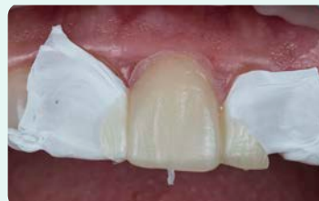
7. הקשיה באור של הקומפוזיט דרך מפתח הסיליקון, ולאחר מכן הסרת מפתח הסיליקון.