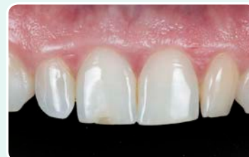
1. מצב התחלתי