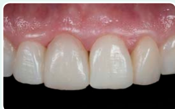
9. תוצאה סופית לאחר שלבי ליטוש ספורים