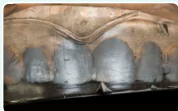
3. לאחר התקשות, הסרת המטבע השקוף מכף המטבע

השקיפות של EXACLEAR מאפשרת לך לבחון כל פרט קטן ומונעת היווצרות של שכבת מניעת-חמצון (oxygen inhibition layer), וכך מקלה על תהליך הליטוש הסופי. G-aenial Universal Injectable מתאים היטב לטכניקה זו, בגלל הטיקסטורופיות הגבוהה שלו, החוזק והברק הסופי.