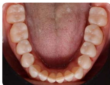
3. המצב לאחר הטיפול, תוך שימוש בטכניקת ההזרקה הישירה

טכניקת ההזרקה לתבנית אידיאלית גם לטיפול במקרי שחיקה סגרית, או ליצירת מחדש של מורפולוגיה מורכבת. השקיפות של EXACLEAR מסייעות לראות ולשלוט בהזרקת החומר, בזמן הטיפול בכמה שיניים במקביל. החוזק הגבוה לכפיפה והעמידות הגבוהה לשחיקה של G-aenial Universal Injectable אידיאליות למקרים כאלו של שיניים אחוריות.