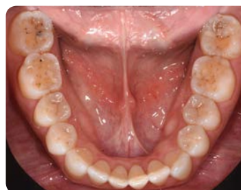
1. מצב התחלתי