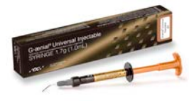
עם G-aenial Universal Injectable

חומר שחזור בהזרקה עם חוזק גבוה וטיקסטורפיות מושלמת