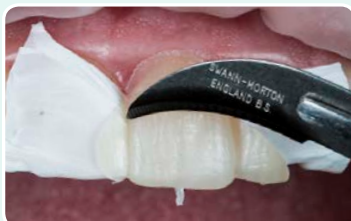
8. סילוק שאריות קומפוזיט באמצעות להב