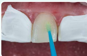
5. בידוד השיניים הסמוכות, צריבת זוגית השן והנחת חומר קישור