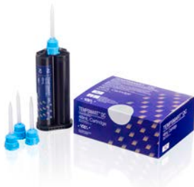
עם TEMPSMART DC

הקשיה מושלמת באור של חומרי שחזור לגשרים וכתרים זמניים דרך EXACLEAR