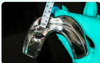
2. מילוי כף מטבע ללא חורים ב-EXACLEAR ולקיחת מטבע של דגם עם השלמת שיעור (wax-up)