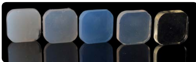
Transparency of EXACLEAR (far right) in comparison to competitors.

שליטה ייזאלית בהזרקת קומפוזיט. *לא סימן מסחרי רשום של חברת GC