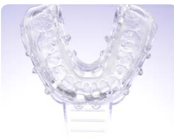
2. מילוי כף מטבע ב-EXACLEAR ולקיחת מטבע של השלמת שיעור על מודל גבס