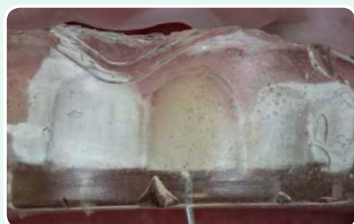
6. מיקום מפתח הסיליקון בפה המתרפא והזרקת שבמפתח G-aenial Universal Injectable דרך החור