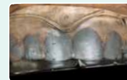
3. Po strditvi, odstranite prozoren silikon iz odtisne žlice