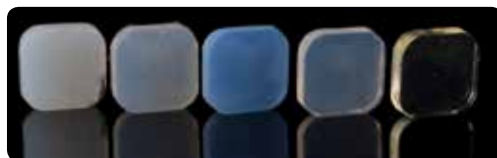
Transparentnost EXACLEAR (popolnoma desno) v primerjavi s tekmeči.

To vodi do visoke stopnje konverzacije, tako izognemo formiranju kisikove inhibicijske plasti, kar naredi končno poliranje enostavnejše .