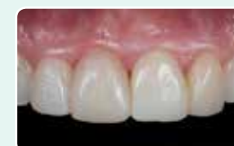
9. Končni rezultat po končnem poliranju