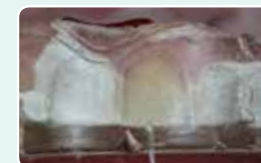
6. Vstavite silikonski ključ v usta in injicirajte G-ænial Universal Injectable preko luknjice v ključu