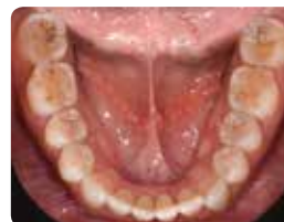
1. Začetna situacija

Tehnika oblikovanja z odtisi je prav tako idealna za oskrbo primerov generalizirane obrabe ali za poustvarjanje kompleksnih morfologij. Transparentnost EXACLEAR pomaga videti in nadzorovati injiciranje kompozita pri oskrbi večjega števila zob naenkrat. Visoka upogibna trdnost in odpornost na obrabo G-ænial Universal Injectable je prav tako idealna za uporabo pri posterioh primerih.