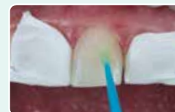
5. Izolirajte sosednje zobe, jedkajte sklenino in nanesite adheziv