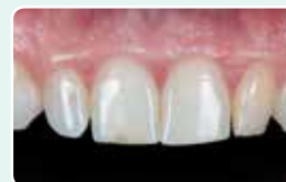
1. Začetna situacija

Translucenca EXACLEAR omogoča, da preverite vsako najmanjšo podrobnost in preprečite formiranje kisikove inhibicijske plasti in s tem pospešite končno poliranje. G-ænial Universal Injectable je zelo dobro prilagojen za to tehniko zaradi svoje tiksotropnosti, trdnosti in sijaja.