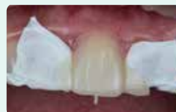
7. Svetlobno polimerizirajte preko silikonskega ključa in ga nato odstranite iz ust