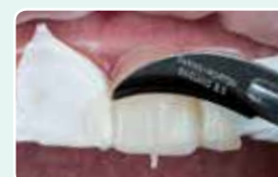
8. Odstranite viške kompozita z rezilom