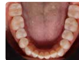
3. Situacija po oskrbi z uporabo tehnike oblikovanja z odtisi (mock-up)