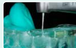
4. Zvrtajte luknjo skozi silikonski ključ da ustvarite prostor za konico tekočega kompozita