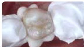
Поставяне на възстановяването