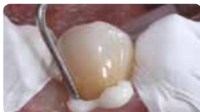
Лесно отстраняване на излишъка наведнъж