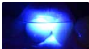
Гумова консистенція досягається лише за 3 секунди преполімеризації