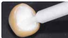
Дозування з автоматичною насадкою