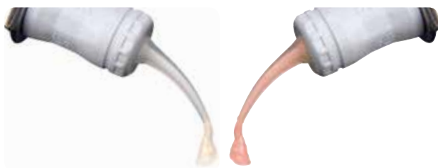
Viscosité optimale, fluidité et rétention lorsqu'il est en place