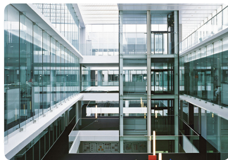
GC-jev raziskovalni center v Itabashiju na Japonskem

Izvirne formule smo že večkrat izboljšali, najbolj pa so se spremenili njihovo rokovanje, moč, stopnja obrabe in estetike. Vse nadgradnje temeljijo na dolгих letih izkušenj, predanem raziskovalnem delu in željah naših strank.