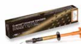
G-aenial Universal Injectable Composite de restauration haute résistance

Pour plus d'informations sur les références, consulter notre catalogue en ligne.