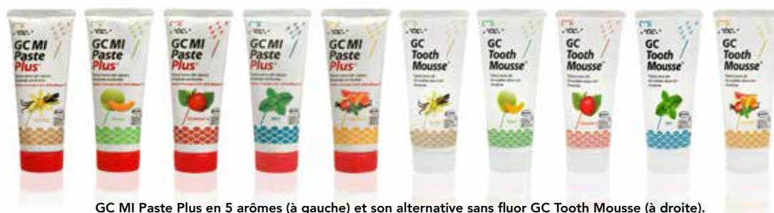
GC MI Paste Plus en 5 arômes (à gauche) et son alternative sans fluor GC Tooth Mousse (à droite).

Les patients dont le flux salivaire est réduit ont tendance à préférer la saveur vanille.