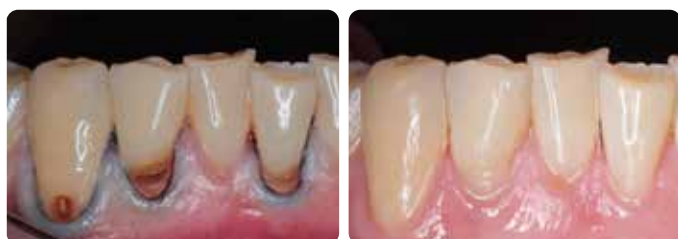
Restaurations MI de lésions carieuses radiculaires avec Fuji II LC, un mois après la pose.

Ces restaurations montrent de bons taux de survie. 7