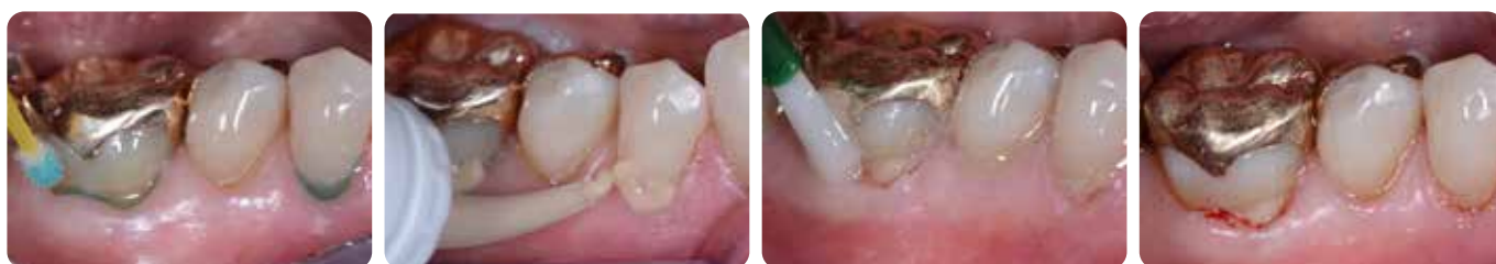
Restauration de lésions carieuses radiculaires avec Fuji TRIAGE, suivie de l'application de MI Varnish.