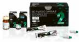
GC Fuji II LC Verre ionomère de restauration photopolymérisable