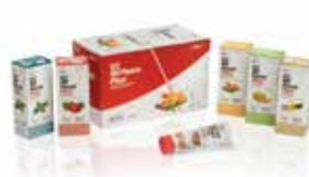
GC MI Paste Plus Calcium et phosphate biodisponibles, avec fluorure