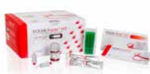
EQUIA Forte HT Système de restauration verre hybride à long terme avec placement en bloc