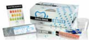
Saliva-Check BUFFER Test en cabinet pour évaluer la qualité de la salive