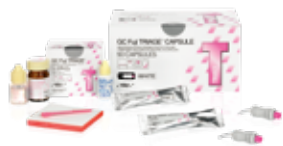
GC Fuji TRIAGE Verre ionomère de protection de surface radioopaque