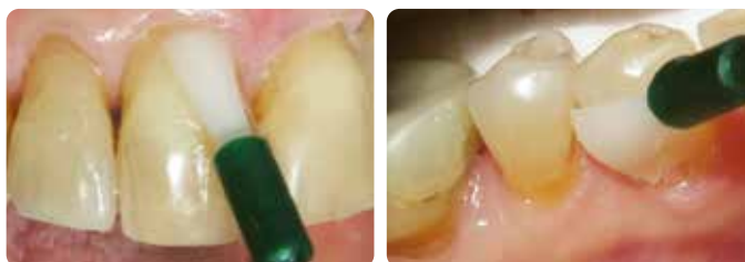
Application de MI Varnish au cabinet dentaire

MI Varnish contient 22600 ppm de fluorure ainsi que du RECALDENT (CPP-ACP) et est destiné à une application au cabinet. Il adhère rapidement aux dents, sans s'agglomérer, et sert de support pour les minéraux et le fluorure, nécessaires au maintien ou à la réparation de l'intégrité de la dent. RECALDENT (CPP-ACP) et le fluor travaillent en synergie : lorsque RECALDENT (CPP-ACP) entre en contact avec le fluor, il stabilise les ions fluor afin de créer une source idéale pour la construction de fluoroapatite, plus résistante aux acides.