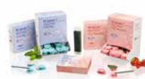
MI Varnish Vernis fluoré amélioré avec du calcium et du phosphate biodisponibles