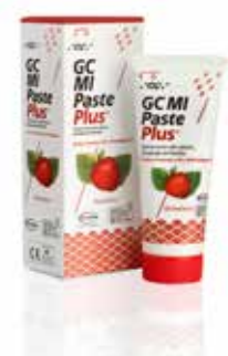
MI Paste Plus