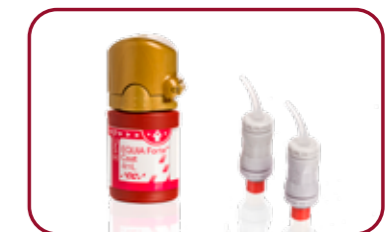
EQUIA Forte™ HT Kustannustehokas, pitkäikäinen täytemateriaali vaihtoehto