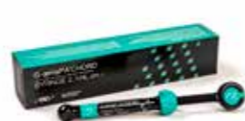
G-ænial A'CHORD Universaali yhdistelmämuovi

EQUIA Forte, everX Flow ja G-ænial ovat GC:n tavaramerkkejä.