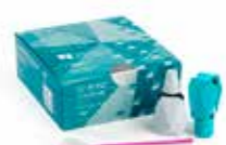
G2-BOND Universal Kahden pullon universaali sidosaine