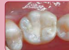
Tohtori A. Patelin luvalla, Yhdistyneet kuningaskunnat