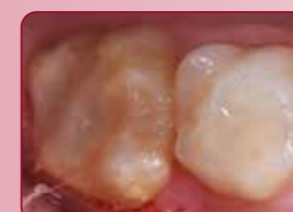
Tohtori P. Rouasin luvalla, Ranska