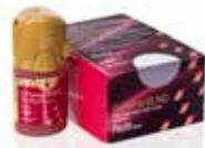
G-Premio BOND Universaali sidosaine