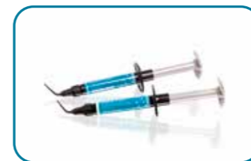
everX Flow™ Katkokuituvahvistettu juokseva yhdistelmämuovi dentiinin korvaamiseen