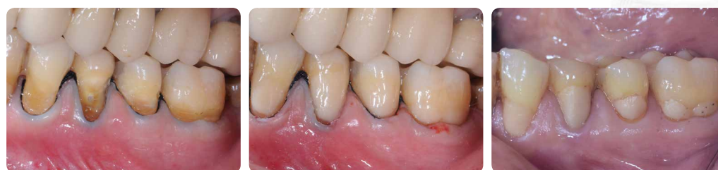
EQUIA Forte (prethodnik materijala EQUIA Forte HT) restauracije prije terapije (lijevo), na početku terapije (u sredini) i nakon 6,5 godina funkcije (desno).