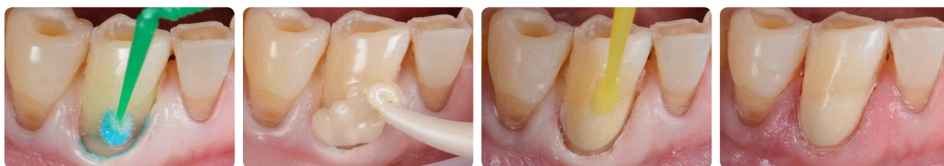
Cervikalna restauracija s materijalom EQUIA Forte HT

EQUIA Forte HT , staklohibridni restaurativni materijal, ima odgovarajuću konzistenciju za postavljanje i oblikovanje. EQUIA Forte Coat mu omogućuje lijepu i otpornu završnu obradu i sjaj te dodatno pridonosi čvrstoći, stvarajući pogodno okruženje za sazrijevanje i jačanje materijala. Njegovo jednostavno postavljanje posebno je pogodno kod liječenja karijesa korijena zbog otpornosti na vlagu i brzine liječenja, čak se može oblikovati prstom. Štoviše, kroz ionsku izmjenu, ovakve restauracije potiču remineralizaciju i sprječavaju demineralizaciju zuba te su stoga najbolja opcija za aktivne lezije.