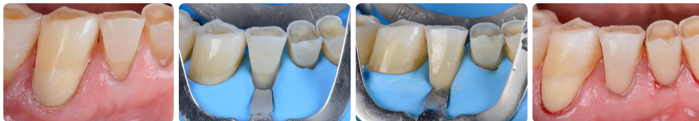
Visokoestetska cervikalna restauracija s kompozitom G-ænial Universal Injectable Ustupio dr. Javier Tapia Guadix, Španjolska

Osim toga, savitljivi vrh aplikatora i tiksotropna svojstva materijala olakšavaju pristup čak i kavitetima u području stražnjih zubi i kontrolu postavljanja u teško dostupnim područjima. Raspoloživ je u raznim nijansama, što omogućuje izradu vrlo estetske i neupadljive restauracije, kakvu pacijenti sve češće traže.