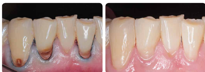
Minimalno interventne restauracije lezija korijena karijesa pomoću staklenoionomera Fuji II LC, mjesec dana nakon izrade.

Fuji II LC je indiciran za svaki slučaj gdje su brzina i jednostavnost korištenja prioriteti. To može biti potrebno kod pacijenata koji ne mogu surađivati ili im nedostaju potrebne kognitivne ili fizičke sposobnosti za potpunu suradnju. Ove restauracije imaju dobru dugotrajnost. 7