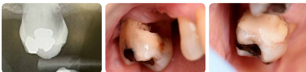
ART subgingivna restauracija s materijalom EQUIA Forte HT

Iako u mnogim slučajevima atraumatski restaurativni tretman (Atraumatic Restorative Treatment - ART) neće biti prva opcija, ova se tehnika može primijeniti u slučaju pacijenata koji ovise o skrbi drugih i koji ne mogu doći u ordinaciju, ili u bilo kojem drugom slučaju kada se ne mogu koristiti rotirajući instrumenti. 6,10 Materijal je dostupan u obliku prah/tekućina za rad bez miješalice za kapsule. Kod ART tehnike uklanja se samo inficirani dentin, no zadržava se zahvaćeni/kožasti dentin blizu pulpe, čime se održava vitalnost pulpe i izbjegava osjetljivost. Savršeno čisti rubovi osiguravaju uspjeh restauracije. U većini slučajeva anestezija nije potrebna.