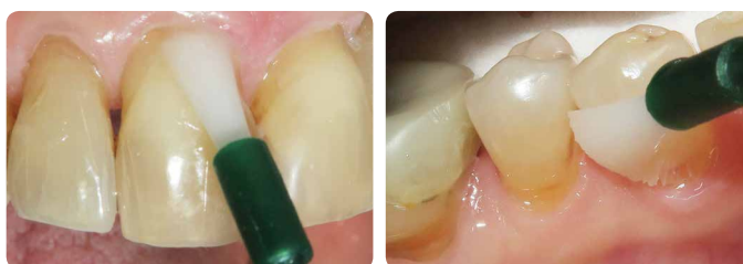
Uporaba MI Varnish u ordinaciji

MI Varnish sadrži 22600 ppm fluorida kao i RECALDENT (CPP-ACP) te je namijenjen za nanošenje u ordinaciji. Brzo prijanja uz zube bez grudica i služi kao spremnik minerala i fluorida potrebnih za održavanje ili popravak zuba. RECALDENT (CPP-ACP) i fluorid djeluju u sinergiji: kada RECALDENT (CPP-ACP) dođe u dodir s fluoridom, stabilizira ione fluorida i stvara idealan izvor za izgradnju fluorapatita otpornijeg na kiseline.