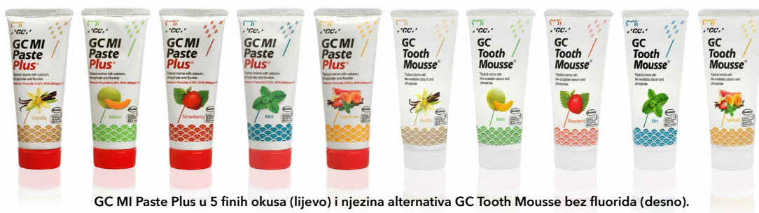
GC MI Paste Plus u 5 finih okusa (lijevo) i njezina alternativa GC Tooth Mousse bez fluorida (desno).

Pacijenti sa smanjenim protokom sline skloni su izabrati okus vanilije.