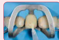
Spajanje sa svim podlogama

Dokazana formula adheziva G-Premio BOND osigurava spajanje sa svim podlogama. Zasebno se stvrdnjava i toliko je tanak da ne smeta nanošenju na restauraciju.