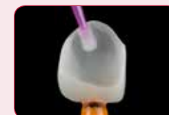
Spajanje sa svim restauracijama

Nakon tačne pripreme (jetkanje ili pjeskarenje), G-Multi PRIMER osigurava postojanu adheziju za sve estetske restaurativne materijale.