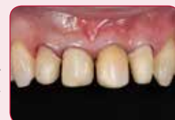
Četiri estetske boje

G-CEM Veneer dostupan je u četiri različite boje. Pažljivo su izabrane kako bi zadovoljile sve estetske potrebe.