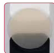
A2 Standardna boja za cementiranje veće protetskih restauracija.