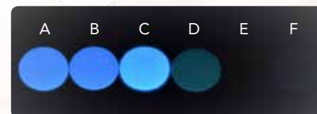
Fluorescencija - 0,5 mm pločice. A: G-CEM Veneer; B: Variolink Esthetic; C: Panavia V5; D: NX3 Nexus; E: Calibri; F: RelyX Unicem

Uz G-Premio BOND i G-Multi PRIMER, osigurava visoku čvrstoću spoja za postojeane, estetske restauracije . Ima mehanička svojstva slična kompozitima u obliku paste, uz lako rukovanje uslijed niske viskoznosti.