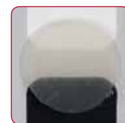
Translucent (transluentna) Savršena za vrlo tanke restauracije, za zadržavanje prirodne boje.