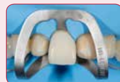
Predvidiv završni rezultat

Pomoću Try-in paste lako se može predvidjeti završni rezultat. Pomaže u izboru tačne boje i opaciteta.