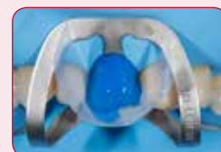
Izbor načina jetkanja

Jetkati rubove cakline ili koristiti pristup totalnog jetkanja za minimalne preparacije lokalizovane uglavnom u caklini.