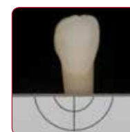
Bleach (za bijeljenje)