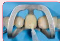
Spajanje sa svim podlogama

Dokazana formula adheziva G-Premio BOND osigurava spajanje sa svim podlogama. Zasebno se stvrdnjava i toliko je tanak da ne smeta nanošenju na restauraciju.