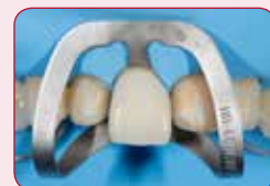
Predvidiv završni rezultat

Pomoću Try-in paste lako se može predvidjeti završni rezultat. Pomaže u izboru točne boje i opaciteta.