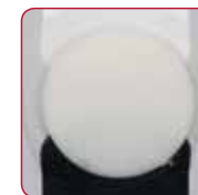
Bleach (za beljenje)

Koristi se za prekrivanje diskolorisanih podloga, ako je potrebno