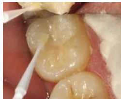
GC Coat PLUS על גבי גלאס ינומר