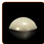
Tekuć pod utjecajem sile smicanja

Za vrijeme postavljanja kolčića u kanal, GRADIA CORE postaje vrlo tekuć, što osigurava dobru prilagodbu kolčića. Međutim, tijekom faze nadogradnje, zadržava oblik.