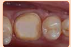
Osnova izrađena kao bataljak za krunicu