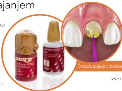
Čvrstoća spajanja s dentinom (MPa), dvostruko stvrdnjavanje 21

Miješanjem u omjeru 1:1 s aktivatorom za dvostruko stvrdnjavanje (DCA - dual-cure activator), osigurana je polimerizacija spoja, čak i u najdubljim točki korijenskog kanala.