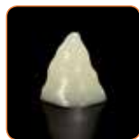
Stabilan kad nema pritiska