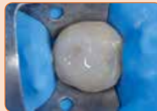
Nadogradnja pomoću GRADIA CORE