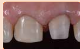
Nadogradnja kompozitom GRADIA CORE