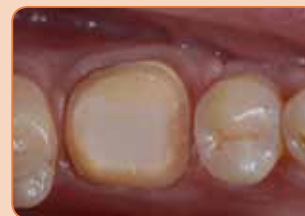
Stumbrs slipēts kroņa abatmentam