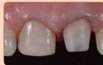
Stumbra atjaunošana ar GRADIA CORE