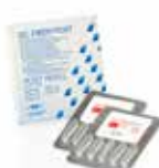
FIBER POST Cietās stikla šķiedras tapas