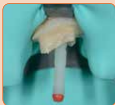
Tapas pielaiķošana un saitēšana ar G-Premio BOND & duālās cietēšanas aktivatoru (DCA)