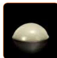
Fluid sub influența stresului de forfecare

În timpul inserției pivotului în canalul radicular GRADIA CORE devine mai fluid, fapt ce asigură o bună adaptare. Cu toate acestea, pe perioada procedurii de refacere a bontului își menține forma.