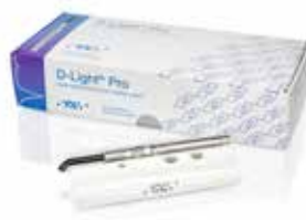
D-Light Pro Lampă de polimerizare LED cu lungime duală de undă

D-Light Pro, everStickPOST, everX Flow, G-Multi PRIMER, G-Premio BOND, G-Premio BOND DCA, FIBER POST și GRADIA CORE sunt mărci înregistrate a GC.