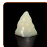
Formă stabilă în absența presiunii