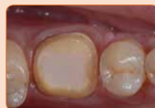
Preparația bontului protetic