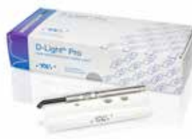
D-Light Pro LED polimerizacijska lučka z dvojno valovno dolžino

D-Light Pro, everStickPOST, everX Flow, G-Multi PRIMER, G-Premio BOND, G-Premio BOND DCA, FIBER POST in GRADIA CORE so blagovne znamke podjetja GC.