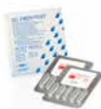
FIBER POST Trdi zatički iz steklastih vlaken