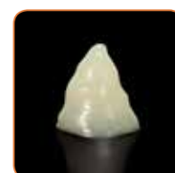
Stabilna oblika ob odsotnosti pritiska