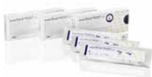
everStickPOST Individualno oblikovani zatički iz steklastih vlaken