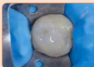
Izgradnja jedra z GRADIA CORE