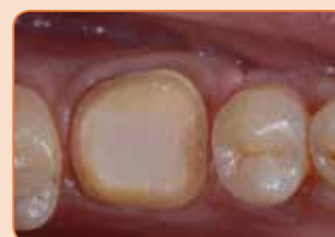
Preparacija jedra kot nadzidek za prevleko