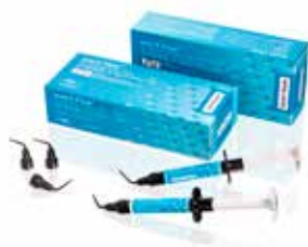
everX Flow Tekoči kompozit ojačan z kratkimi steklastimi vlakni za nadomestitev dentina