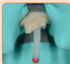
Preizkus zatička in adhezivna vezava z G-Premio BOND & aktivatorjem za dvojno strjevanje (DCA)