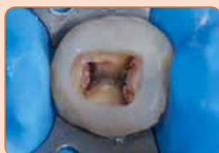
Po endodontskem zdravljenju