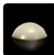
Tekoča pod vplivom strižnih sil

Med vstavljanjem zatička v koreninski kanal postane GRADIA CORE zelo tekoča kar zagotavlja dobro adaptacijo na zatiček. Kljub temu med postopkom izgradnje jedra drži obliko.