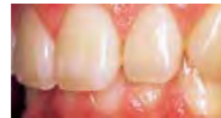
Primjer prednjeg ispuna

Za tehniku jedne boje korištenje jedne standardne boje pruža izvrsni rezultat. Raspoloživ u verziji Anterior (za prednje ispune) i Posterior (za stražnje ispune), svaka predstavlja finu ravnotežu između tona, krome, nijanse i translucencije. Anterior verzija (za prednje ispune) ima A, B i C skupine boja koje se temelje na VITAPAN Classical® vodiču za boje, kao i CV (cervikalnu), XBW (ekstra izbjlijedjelu bijelu) i BW (izbjlijedjelu bijelu) nijansu. Posterior verzija (za stražnje ispune) ima samo A boje.