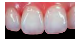
Primjer prednjeg ispuna

To su neprozirne boje koje se postavljaju ispod standardne boje i pružaju toplinu konačnoj boji te blokiraju "tamni sjaj" usne šupljine. Postoje četiri unutarnje specijalne boje: AO2, AO3, AO4 i X-AO2.