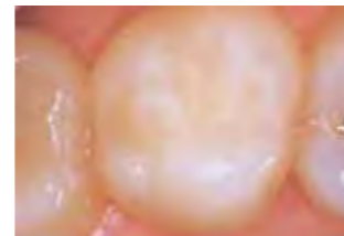
Primjer stražnjeg ispuna