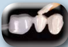
Appliquez une couche de GC Initial IQ Light Reflective Liner pour masquer l'armature Zirconium.