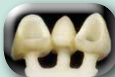
Résultat après pressée.