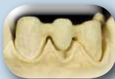
Appliquez une fine couche de Power Frame Modifiers (PFM).