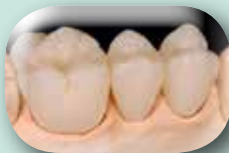
Résultat après une cuisson.