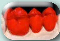
Volume définitif complet en monocouche.