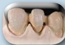
Appliquez la première couche d'Opaque (lait d'opaque) avec une pâte Opaque GC Initial MC à l'aide d'un pinceau plat. Avant la cuisson, saupoudrez la surface de cristaux « Fluor crystals ».