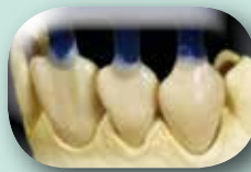
Après les cuissons des Opaques, la restauration est totalement recouverte de cire (système de préforme). L'épaisseur minimale doit être de 0.8 mm pour obtenir un résultat final esthétique correct.