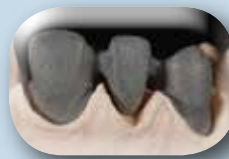
Armatures coulées ou usinées (CAD/CAM).