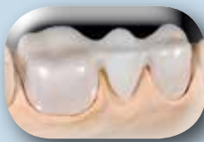
Armature en dioxyde de zirconium