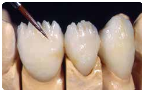
Нанесення Lustr Pastes NF (+спікання)