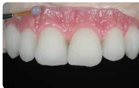
Нанесення різних Initial Lustre Pastes NF Ясенні Відтінки