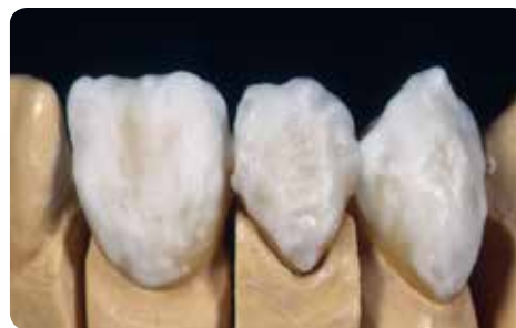
Нанесення Опалових/Емалевих мас (+спікання)