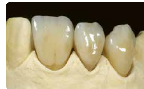
Фінальна реставрація демонструє колір та блиск