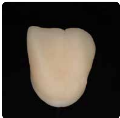
Коронки з тонкою текстурою, що готові до глазурування

Initial Spectrum Stains можна наносити у бажаній консистенції: пастоподібну чи більш рідку. Незалежно від обраної консистенції, кінцевий результат буде однаковим: відтінок та рівень блиску точно визначені, зберігається текстура поверхні реставрації; Initial Spectrum Stains - це 2D-двійник Initial Lustre Pastes NF.