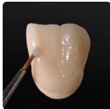
Глазурування з рідкою чи пастоподібною консистенцією