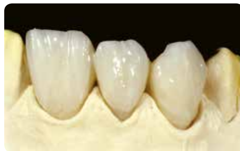
Нанесення LP Neutral