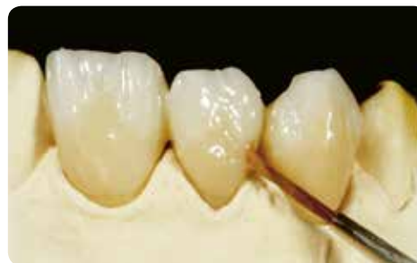
Нанесення Body Shades