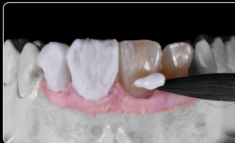
... za tehnike mikroslojevanja i bojanja