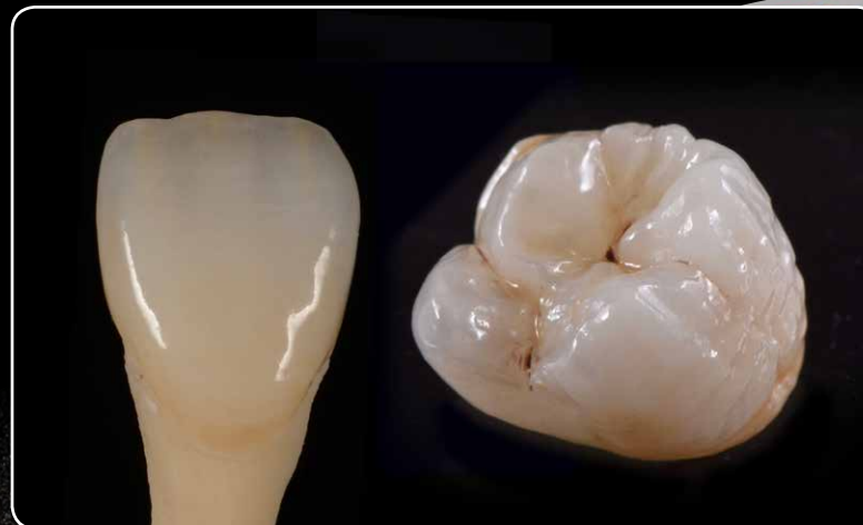
... za restauracije u prednjem i stražnjem području