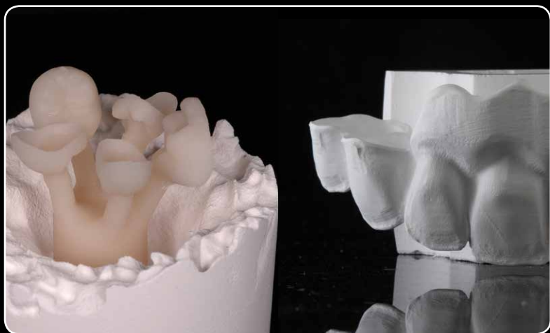
... za sve vrste restauracija iz cirkonij-oksidne i litij-disilikatne potpune keramike