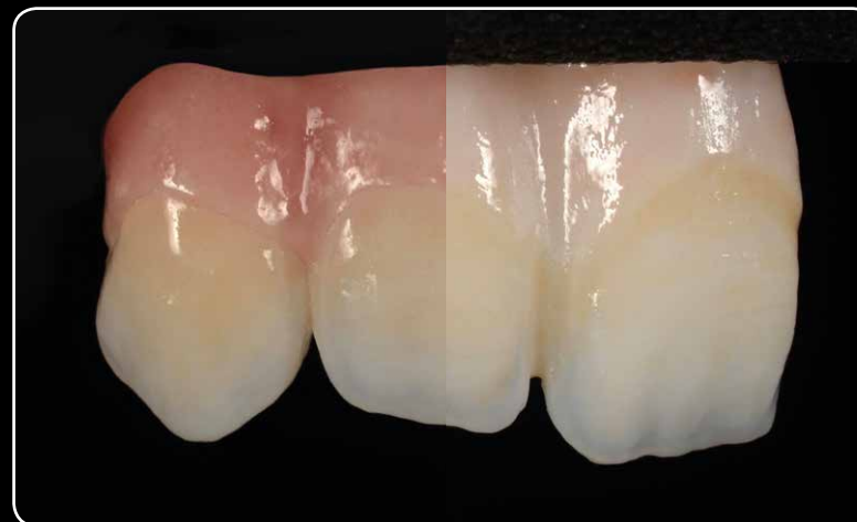
Initial IQ Lustre Pastes ONE takođe služe za pečenje vezivnog sloja.