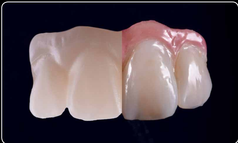
maksimalnoj estetici u mikro sloju