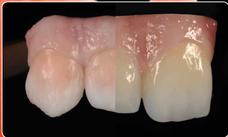
Izrada oblika i fine teksture u mokrom stanju. Bez promjene nakon pečenja.