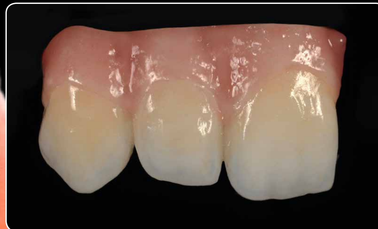
Osobine samoglaziranja. Za lijepi glazirani završni izgled s jednim pečenjem.