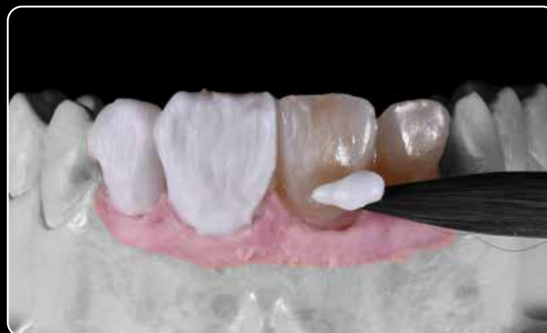
...para las técnicas de microcapas y maquillaje