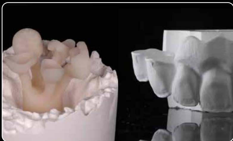
...para todas sus realizaciones de cerámica a volumen total con Zr y LDS