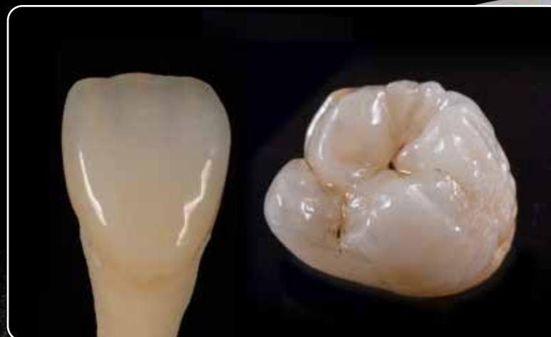
... priekinių ir krūminių dantų restauracijoms