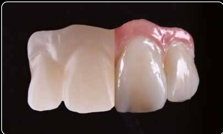
Maksimali estetika dengiant net ir ploniausiu sluoksniu