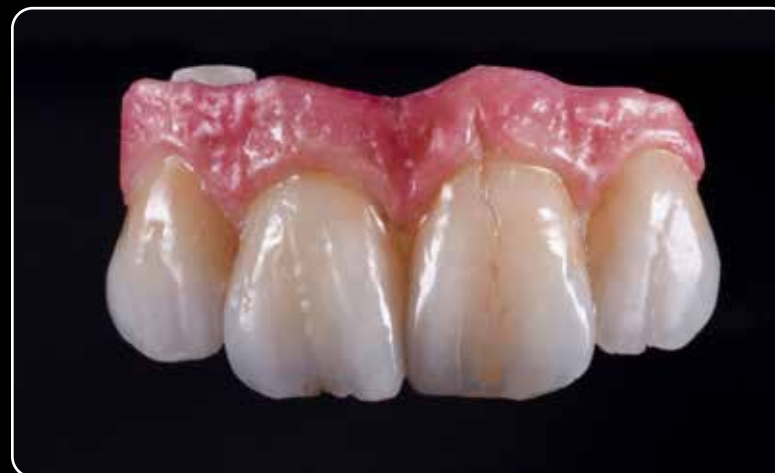
Rausva ir balta estetika